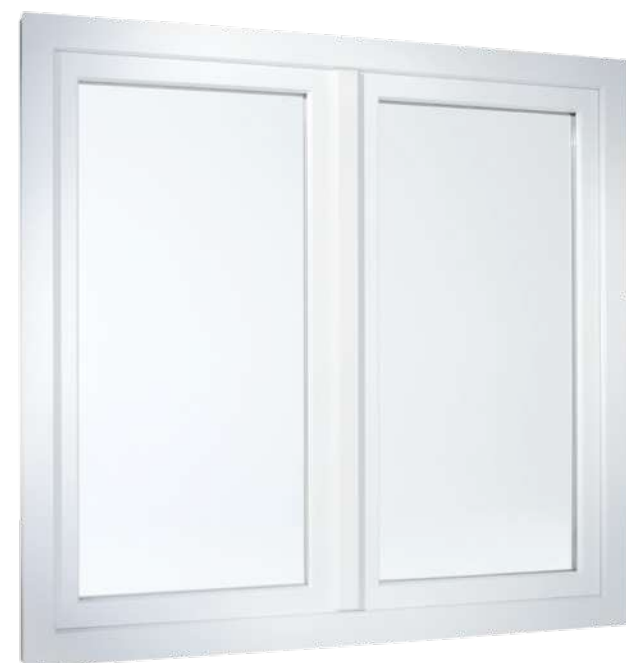
2-flügeliges Fenster in flächenversetzter Variante