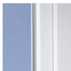
Klassisches Design mit weicher Kontur

Mit modernen Kunststofffenstern aus VEKA Profilen gewinnt jedes Haus. Denn das klassische Design des SOFTLINE Systems mit der leicht abgerundeten Kontur ist zeitlos und harmonisiert hervorragend mit unterschiedlichsten Architekturstilen – ob modern oder traditionell, ob Neubau oder Renovierung.